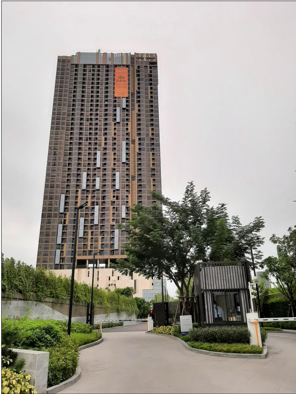
ภาพที่ 1.2-2 สภาพปัจจุบันของโครงการ